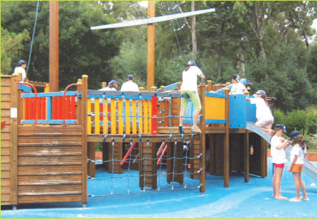
Brincadeiras no Parque