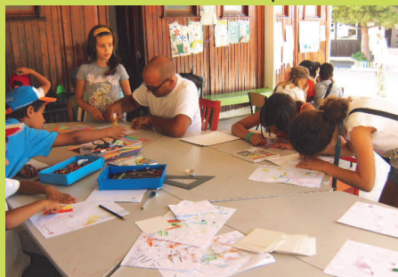
Atividades de Verão