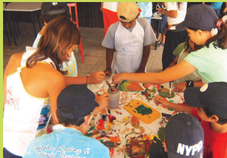
Pintura e Decalque