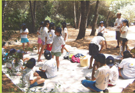
Picnic na Colônia