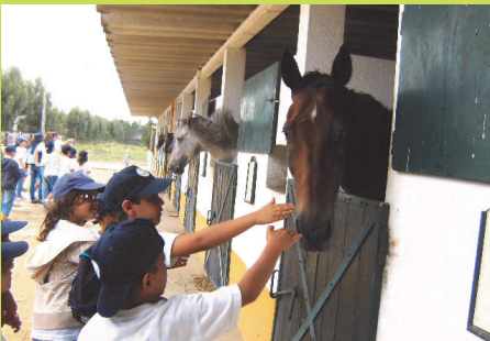
Barragem dos Patudos