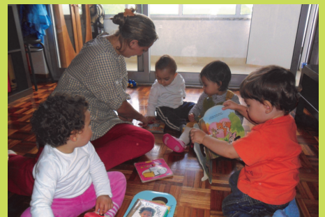
Brincar com a nossa Ama