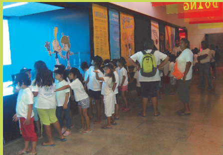
Pavilhão Ciência Viva