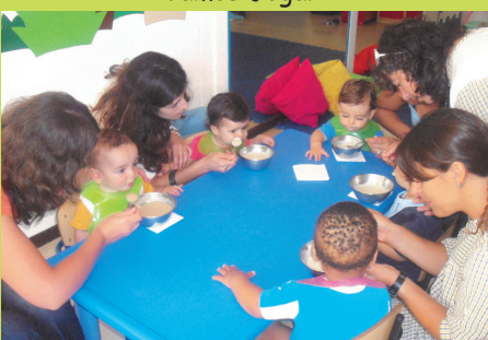
Período Adaptação Creche