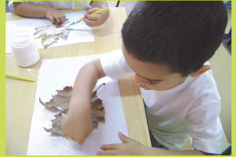
Atividade de Colagem