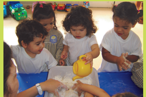
Atividade Massa de Cores