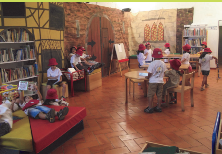
Biblioteca Municipal da Póvoa