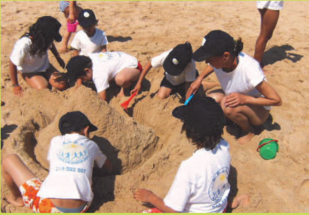
Brincadeiras na Areia