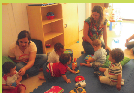
Período Adaptação Creche