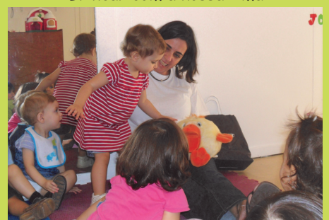
Atividades da Creche Familiar com a sala de 1 ano