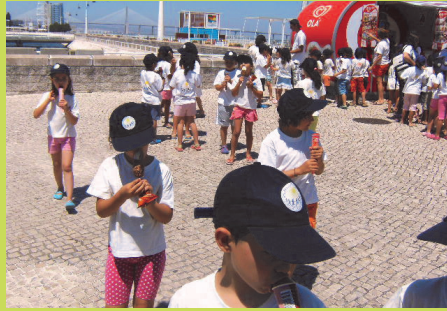
Hora do Gelado