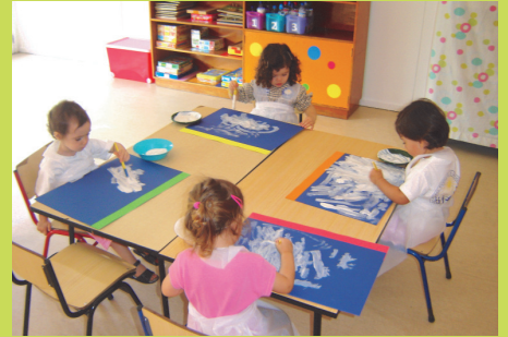
Atividade de Pintura